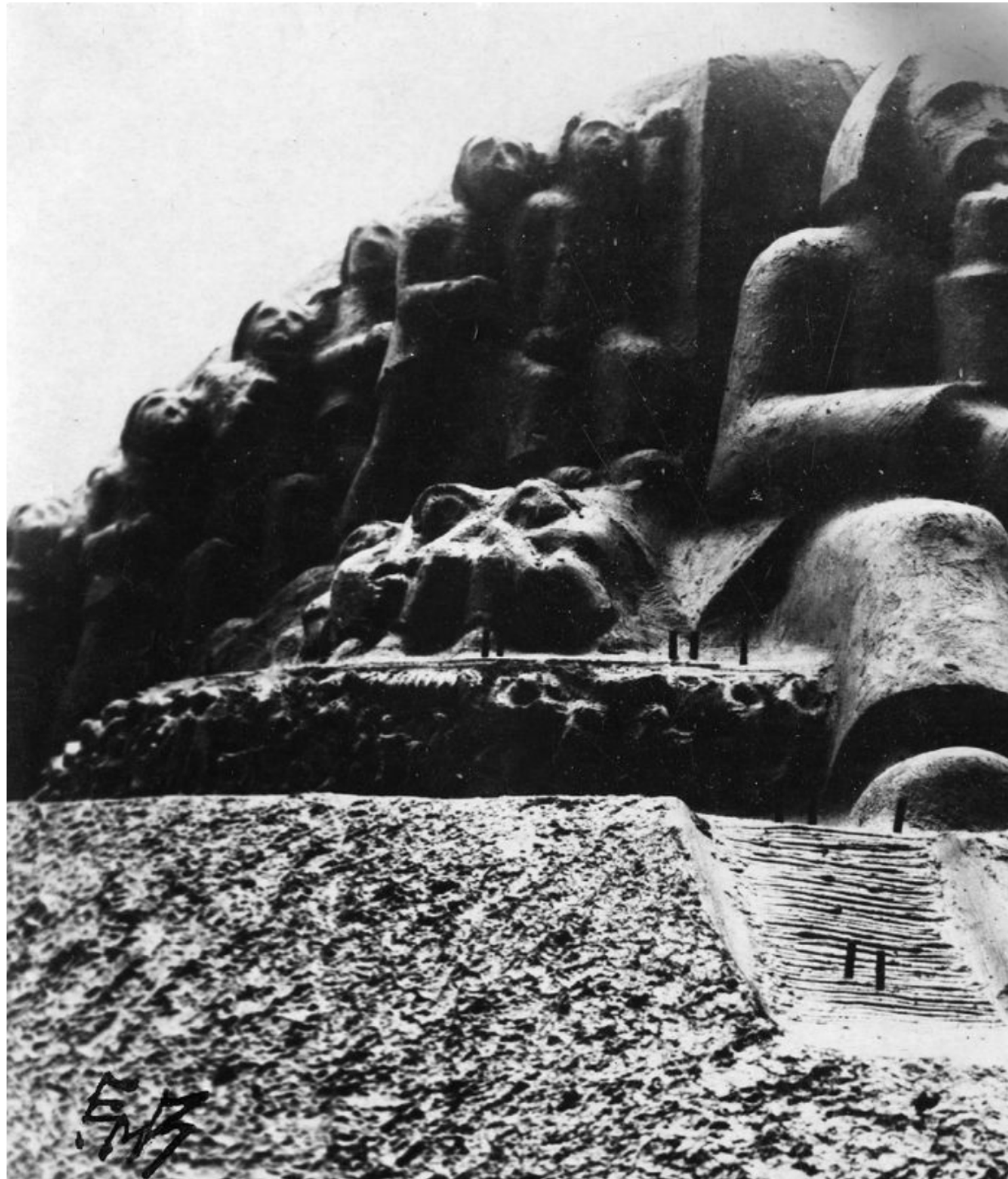
POLARMONUMENTET: Etter initiativ fra en tysk billedhugger, ble det planlagt et gigantisk monument som skulle hedre verdens polarforskere,

- Da forstår du hvorfor dette er militært område. Jeg kan medgi at det lokale militæret på 1930-tallet var «ditt» skeptisk til å slippe en tysker inn på militært område. Muligens med god grunn, sier Vollset med et smil.