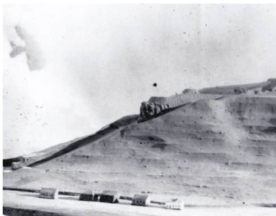
SANDVIKSFJELLET: Monumentet var planlagt på Sandviksfjellet.