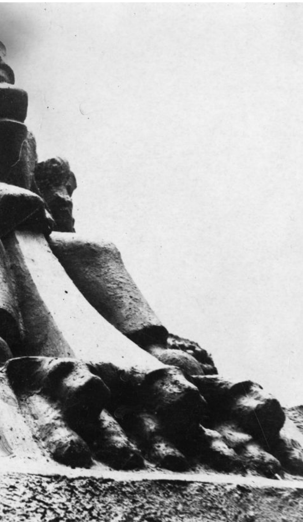
med Fridtjof Nansen i front.